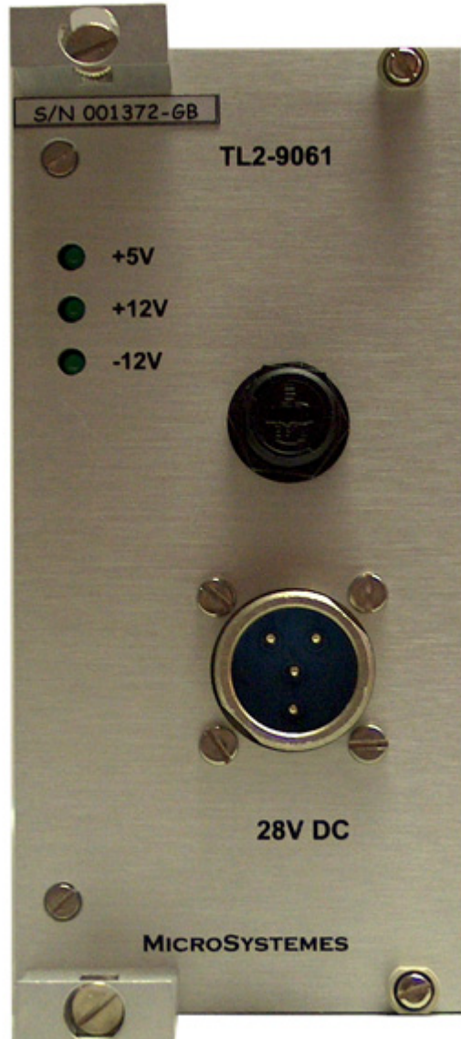
Figure 2. Face du module.

La figure 2 montre l'implantation des connecteurs et les marquages réalisés par sérigraphie. Le brochage des connecteurs est décrit en détails au chapitre 2.